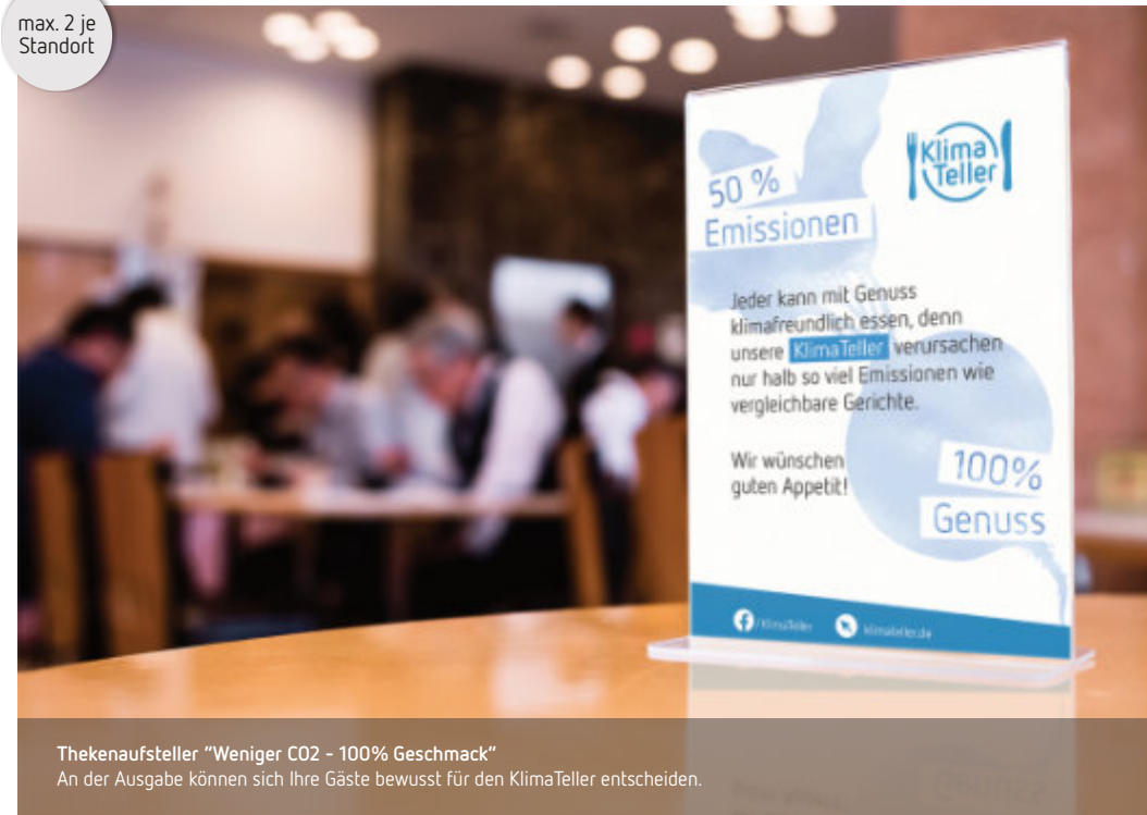
Tischaufsteller "Weniger CO2 - 100% Geschmack" Beim Genuss des KlimaTellers erfahren Ihre Gäste, worauf es Ihnen ankommt und erkennen ganz nebenbei, welchen Beitrag sie für den Klimaschutz leisten.